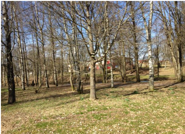
Parkområde mot det håll där fåran till Åtran löper