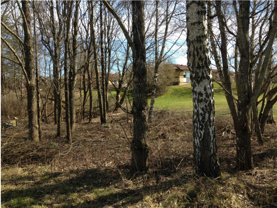
Smalt bälte av lövskog i västra delen av planområdet