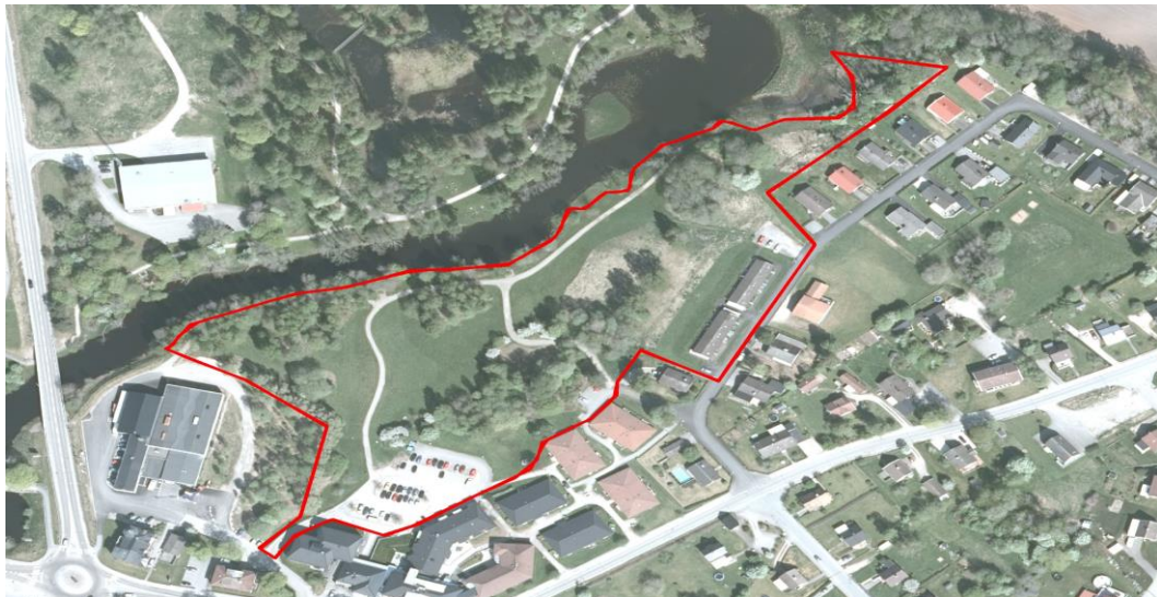
Bilder från området i helhet