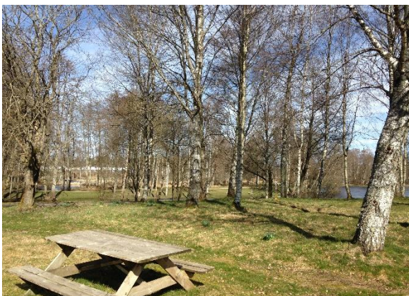
Parkområde mot det håll där fåran till Åtran löper