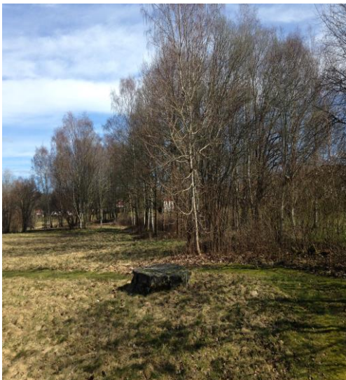
Lövträdsbälte med stenblock i förgrunden

Lövskogsbältet i området tänkt för byggnation, växer främst björk, yngre lönn och sälg. Ingen ytterligare växtlighet än kirskaål, timotej, gröe och andra gräsarter samt sly i marknivå, i mars månad syntes även enstaka exemplar vårlök. Marken relativt torr trots rikligt regn. Naturvärden på platsen uppfattas som ringa. Den levnadsmiljö som slentrianlövet utgör finns i övrigt representerad rikligt i området.