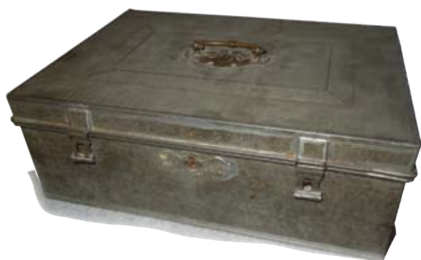
Kassaskrin från gamla Svenljunga köping.